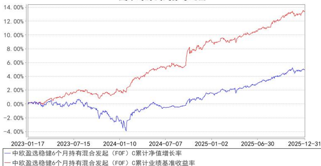
中欧盈选稳健6个月持有混合发起（FOF）C累计净值增长率与同期业绩比较基准收益率的历史走势对比图

注：2024 年 8 月 19 日起，组合业绩比较基准变更为中证纯债债券型基金指数收益率*87%+沪深 300 指数收益率*10%+上海黄金交易所 Au99.99 现货实盘合约收益率*3%。