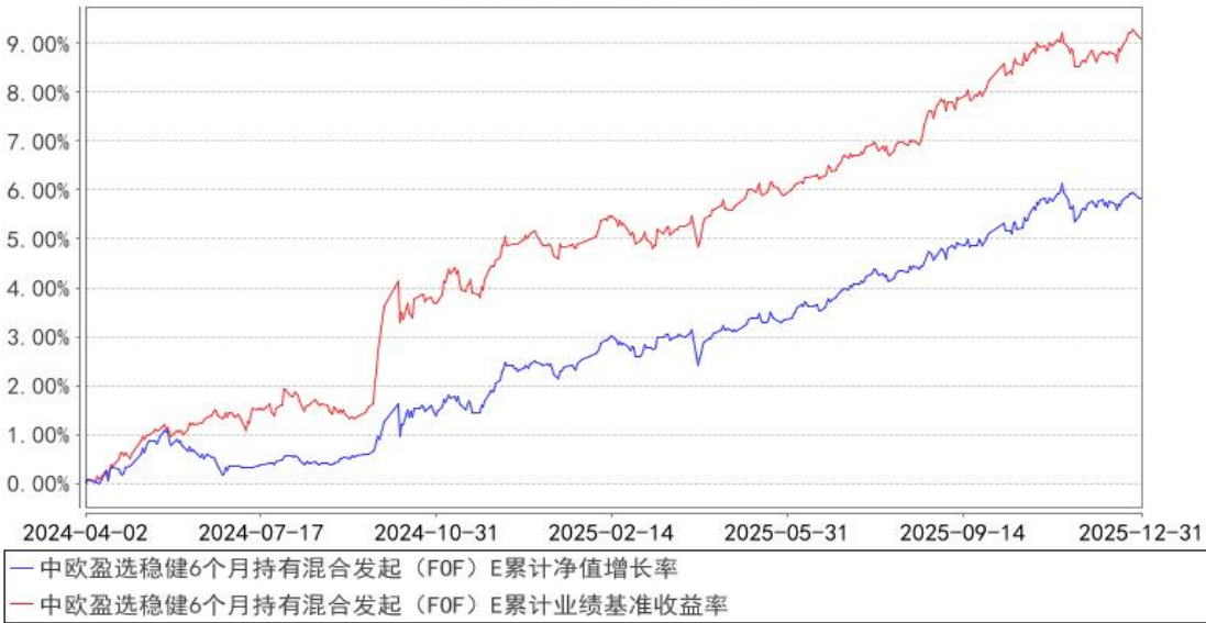
中欧盈选稳健6个月持有混合发起（FOF）E累计净值增长率与同期业绩比较基准收益率的历史走势对比图

注：2024 年 8 月 19 日起，组合业绩比较基准变更为中证纯债债券型基金指数收益率*87%+沪深 300 指数收益率*10%+上海黄金交易所 Au99.99 现货实盘合约收益率*3%。本基金于 2024 年 3 月 28 日新增 E 类份额，图示日期为 2024 年 4 月 2 日至 2025 年 12 月 31 日。